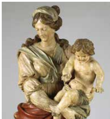
Maria met kind (detail), Antwerpen, ca. 1700 Museum Catharijneconvent

Maria's wonderlijke levensverhaal loopt als een rode draad door de tentoonstelling die de gehele bovenverdieping van het museum beslaat. Vanaf de conceptie tot aan haar tenhemelopneming is Maria in uitingen van kunst te volgen. Ook thema's als devotie en bedevaart passeren de revue. Ontroerende persoonlijke verhalen brengen de menselijkheid van Maria in beeld. De tentoonstelling